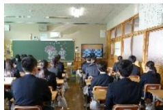
放送による始業式