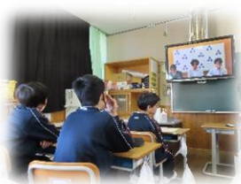
テレビ放送を集中して見る姿