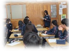
意見発表による共有

11月19日(水)に、「いじめをしない、させない、許さない」ことを確認し誓うことを目的としたいじめ追放集会を行いました。この集会は、毎年2回行っており、本校において大切にしている集会です。今回は、インフルエンザ予防の必要性があったため、テレビ放送を使っ