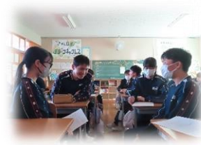
グループでの話し合い