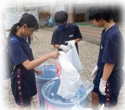
年間を通して行った地道な回収活動