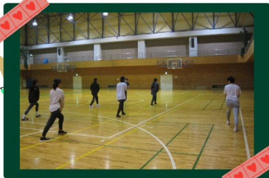
効果を引き出す運動

9月から11月にかけて令和7年度秋期ヤングスワールを実施しました。 12の講座を開催し、延べ195名の方にご受講いただきました。