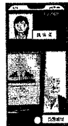
LINEメッセージ・ビデオ通話