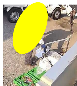
9:51 収集後のゴミ出し