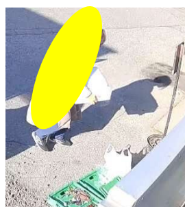
9:42 収集後のゴミ出し