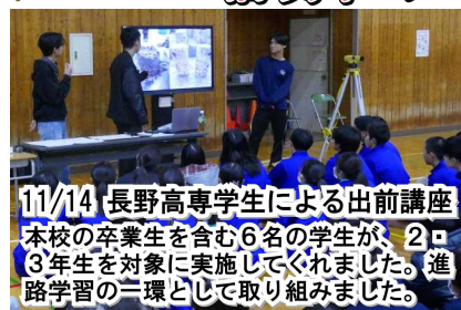
11/14 長野高専学生による出前講座 本校の卒業生を含む6名の学生が、2・3年生を対象に実施してくれました。進路学習の一環として取り組みました。