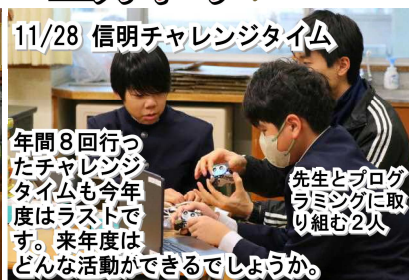
11/28 信明チャレンジタイム

年間8回行ったチャレンジタイムも今年度はラストです。来年度はどんな活動ができるでしょうか。