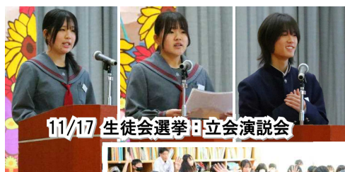
11/17 生徒会選挙・立会演説会

生徒会引継ぎ ：生徒会引継ぎについては、先月号でも候補者による 教室訪問 の様子を紹介しましたが、11月17日(月)には 立会演説会・投開票 が行われ、次期生徒会の中核を担う、正副会長が選出されました。特に、集大成とも言える17日の 立会演説会 では、3週間にわたる選挙活動で練り上げた自分の公約を、1年生1名を含む10名の候補者が堂々と主張する頼もしい姿が見られました。なお、次期生徒会正副会長は、次の3名が選出されました。