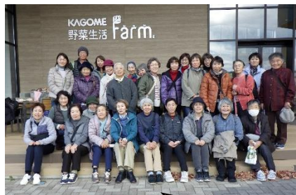
大人の社会見学（11月） （カゴメ（株）野菜生活ファーム）

ささゆりひろば（12月） シューフィッターによる 靴の選び方・足の健康や トラブルのお話