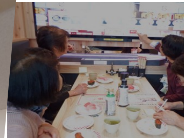
最新回転寿司体験