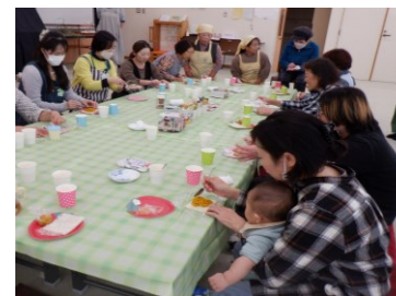
ひろば茶会 赤ちゃん