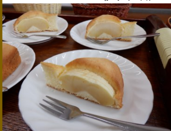
ひろば喫茶てまり