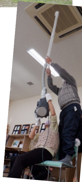
サークル交流会 大掃除