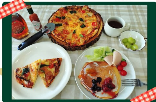
パン & お菓子作り