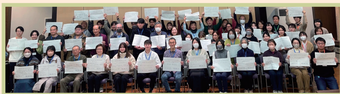
【プランを作成した市民のみなさん】