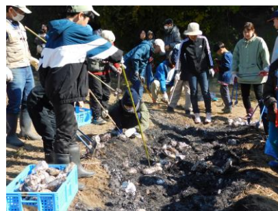
▲うまく焼けたかな?

火の勢いやサツマイモの大きさで中まで焼けないものもありましたが、黄金色に輝く、アツアツのやきいもをその場で堪能していました。当日は消防団の方々も万が一火が燃え広がった時のために来てくれました。