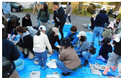
▲焦げないように、うまく焼けてね!

秋晴れのもと、焚火でのやきいも大会で約280名の参加がありました。日頃、体験できない焚火で炭を起こし、サツマイモをその中に放り込んで焼きあがるのを待ちました。