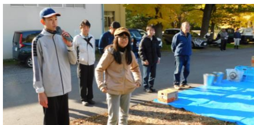
▲子ども会代表による開会宣言

11月8日(土)、丸ノ内中学校北側の畑でやきいも大会が子ども会育成会主催で盛大に開催されました。今年は、猛暑ではあったものの、雨も少なく気象条件が良かったおかげでサツマイモも大豊作で芋掘りの時も楽しそうに笑顔が溢れていました。