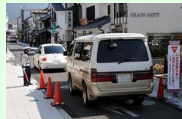
速度抑制社会実験(ゾーン30)