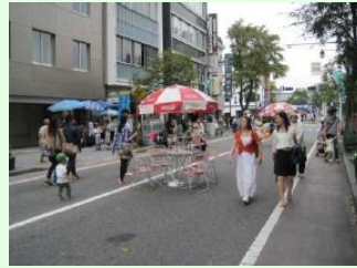
カーフリーエリア