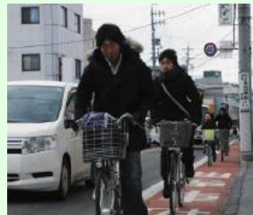
自転車通行レーン