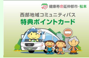
特典ポイントカード