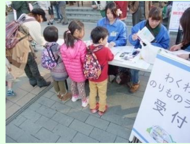
公共交通の企画切符を活用したスタンプラリー