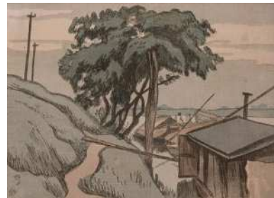
石井柏亭《野田》(木版)