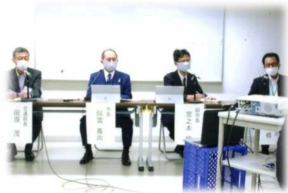
質問に答える市理事者