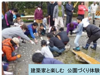
建築家と楽しむ 公園づくり体験