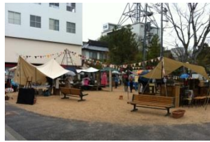
イベント時の様子