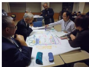
ワークショップで過ごしやすい空間を検討