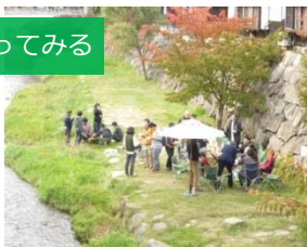
まちづくりサロン