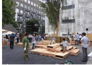
空間づくり体験ワークショップ