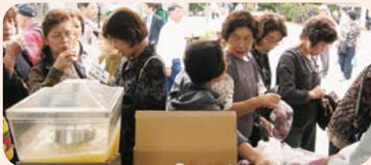
平成 19 年度農林業まつり

今年は「あがたの森」を会場としていろいろな催しを予定しています。皆さんおでかけください。