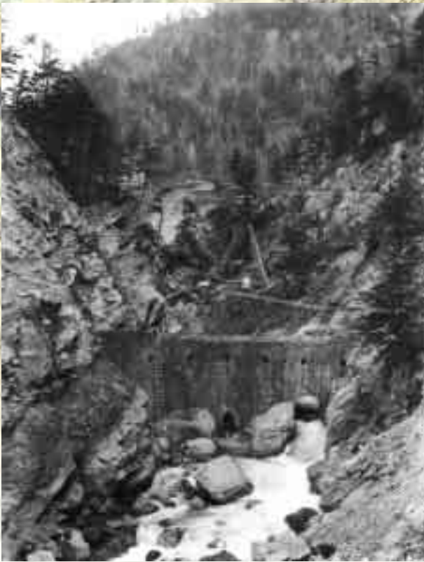
建設中の釜ヶ淵堰堤(昭和12年11月撮影)