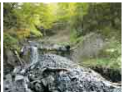
標沢第2号堰堤 昭和8年12月竣工。