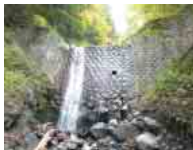
標沢第1号堰堤 梓川水系の直轄砂防事業で最初に完成した砂防ダム。昭和8年10月竣工。

梓川水系では、釜ヶ淵堰堤の着工に先だって、昭和7年(1932年)に国の直轄砂防工事がはじまりました。当初は、梓川沿いの山腹工や、沢渡周辺の沢への小規模な砂防堰堤の建設などが行なわれました。現在でも、それぞれに意匠の異なる練石積堰堤が、ひっそりと当時の姿を残しています。