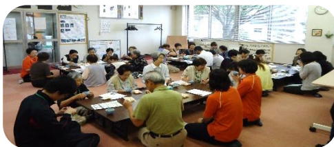
スポーツ吹矢の様子