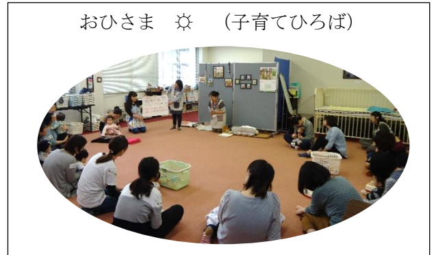
おひさま ☀ (子育てひろば)