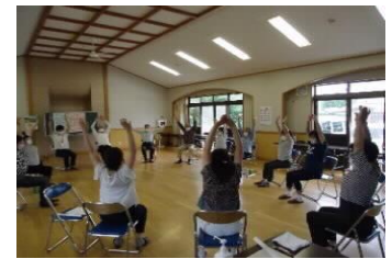
小室町会出前 ふれあい健康教室