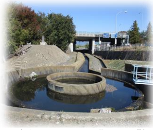
〈芳川のシンボル“四ヶ堰”〉