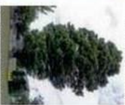
⑨タキノジユーム (市特別天然記念物)

地質時代に繁茂していたクスノキで、天正時代の初期、小学校の職員旅行で北海道へ行った折に持ち帰って植えたもの。