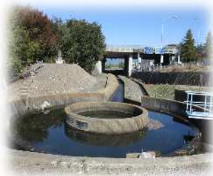
〈芳川のシンボル“四ヶ堰”〉