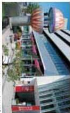
Mウイング・てまり時計