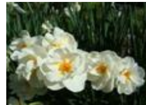
●サーウイトンチャチル