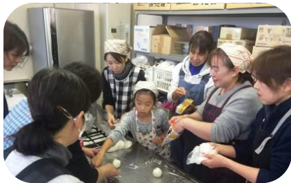
避難所設営を学び、炊出しに有効なバックッキングを体験。