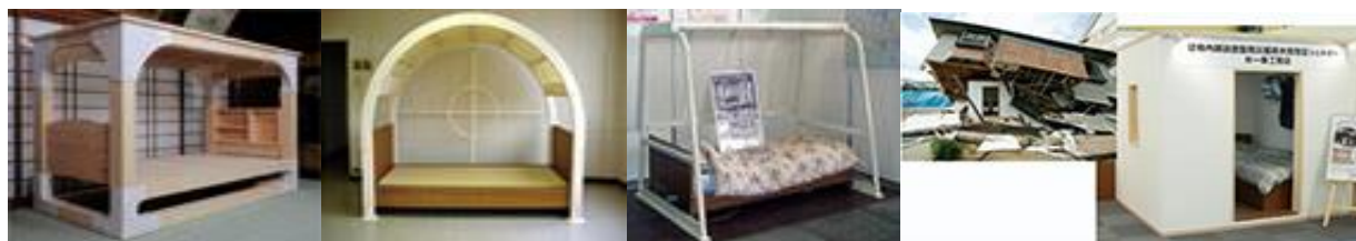
○耐震シェルター等設置例