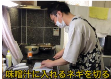
味噌汁に入れるネギを切る

コロナ禍で楽しみにしていた行事が全面中止の中、春休みに小さな子ども食堂良かった👏👏