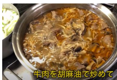
牛肉を胡麻油で炒めて