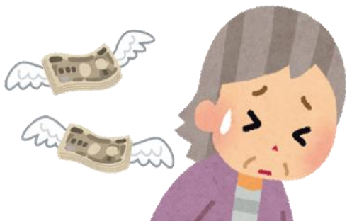
お金のやりくりができない