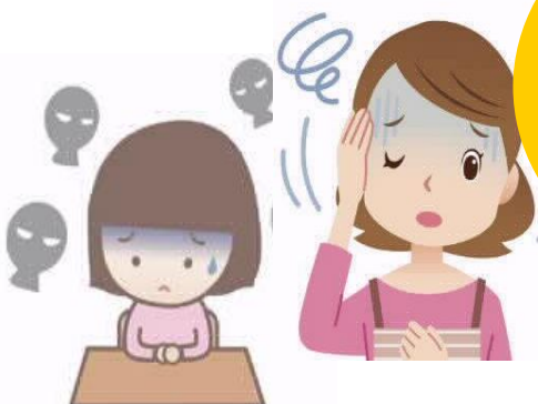
障害のある子どもの将来が不安