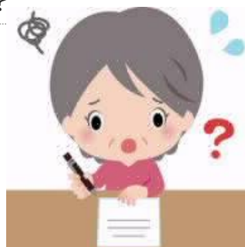
書類の手続きに困っている