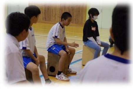
カホンを使った音楽授業(全校)