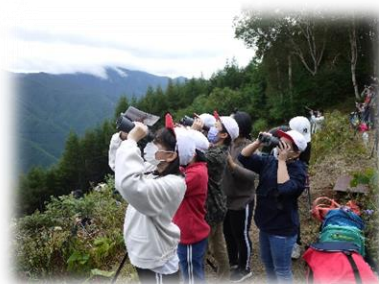
ワシタカの渡り観察(小全)