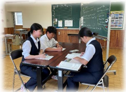
異学年合同授業（中）

◇同様の特色を持つ大野川校、安曇校との交流を行い、集団での活動や学びを実現します。