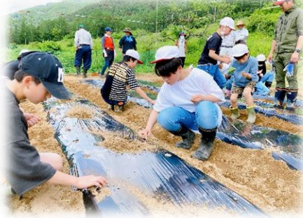
トウモロコシ播種