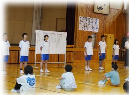
合同国語集会（小中）