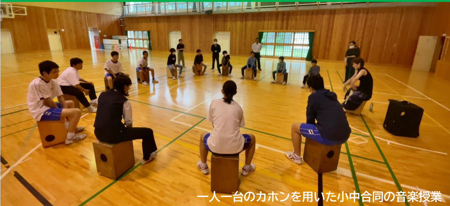
一人一台のカホンを用いた小中合同の音楽授業