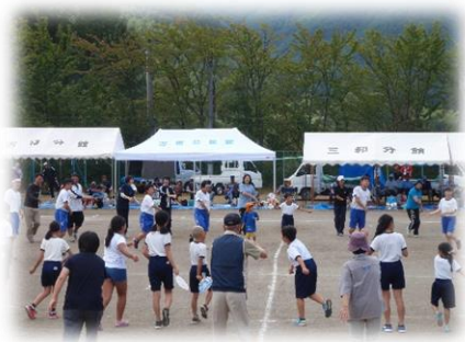
地域の皆さんとの合同運動会