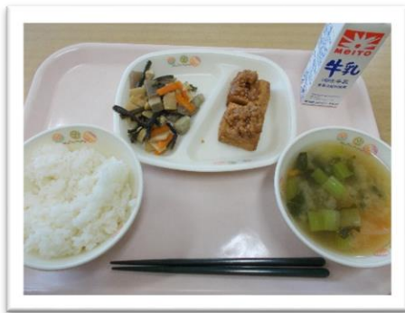
奈川給食（わらび入り）