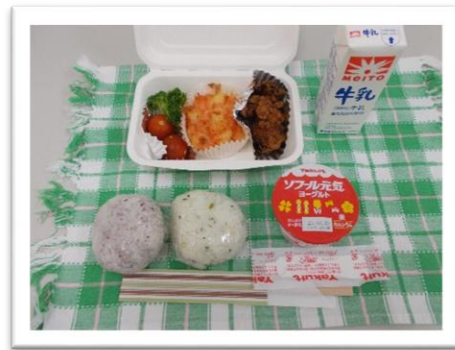
奈川給食（行事対応のお弁当形式）