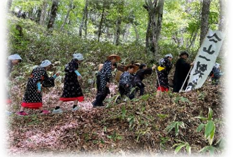
地域行事への参加(小中)