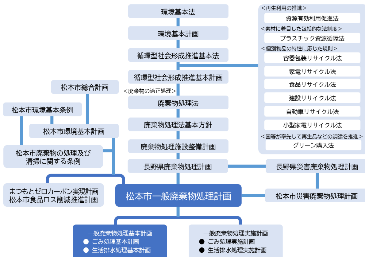
図1-1 本計画の位置付け（環境省のごみ処理基本計画策定指針より一部改変）