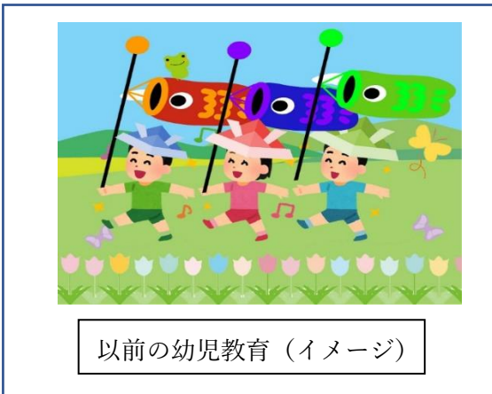
以前の幼児教育 (イメージ)

今日の前にお子さんが成人する頃には私たちが過ごしたことのない社会になっているかもしれない・・・と言われていきます。どのような時代になってもあゆみ続けられるためにも必要と言われる 非認知能力 例えば、主体性、集中力、忍耐力、勇気、やり抜く力。。。。数値では測れないけれど、「生きる力」とも言うべき能力です。同時に 認知能力 を身につけることも大切です。信学会が大切にしてきた伝統ある活動なども行いながらも、「自ら考え行動する」「自分の気持ちを表現する」などの時間をより多く取り入れ「子どもが真ん中」の保育をすすめていきます。考え行動する時間の確保を重視し、クラスの子どもに合わせた環境づくりをするので例年通りではない、また、クラスにより活動内容が異なることもあるかもしれません。過程や手段は異なっても、願いは同じです。今まで同様温かく見守っていただけるとありがたいです。