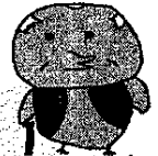
電話でお金詐欺防止キャラクター