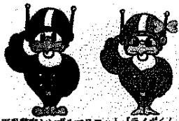
長野県警察シンボルマスコット「ライボくん ライビィちゃん」