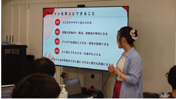
デザイン講座の様子①