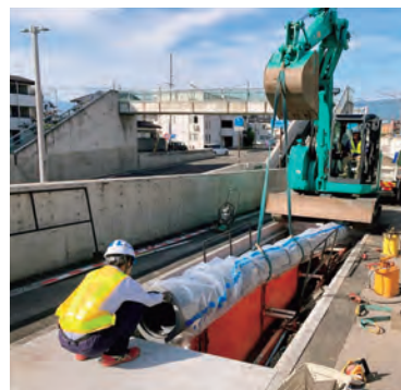
配水管の耐震化工事

A 現在、中心市街地の基幹管路の耐震化を計画的に進めている。令和 6 年度の予算執行後の耐震化率は 40.9 % となる見込み。また、災害対応病院など、重要給水施設への配水管の耐震化も進めている。今後は、新たな基幹管路等についての耐震化計画を策定するとともに、老朽化した配水管の取り替えと、配水管の耐震化を進めていく。