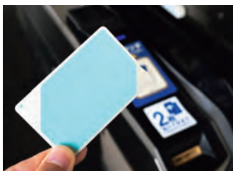
交通系 IC カードの導入

市長 これまで現金のみであった決済手段に、チケットQR、クレジットトタッチ決済サービスを加え、段階的に利便性を高めてきた。長野県が導入支援に対する財政支援制度を整備し、導入に向けた環境が整ったことで、本市としても鉄道とバスのシームレスな乗り換えによって利便性を高め、バス利用者の増大につなげるため、交通系ICカード導入を決めた。令和8年春の供用開始に向け、県や既に導入を決めている長野市と連携し、取り組んでいく。