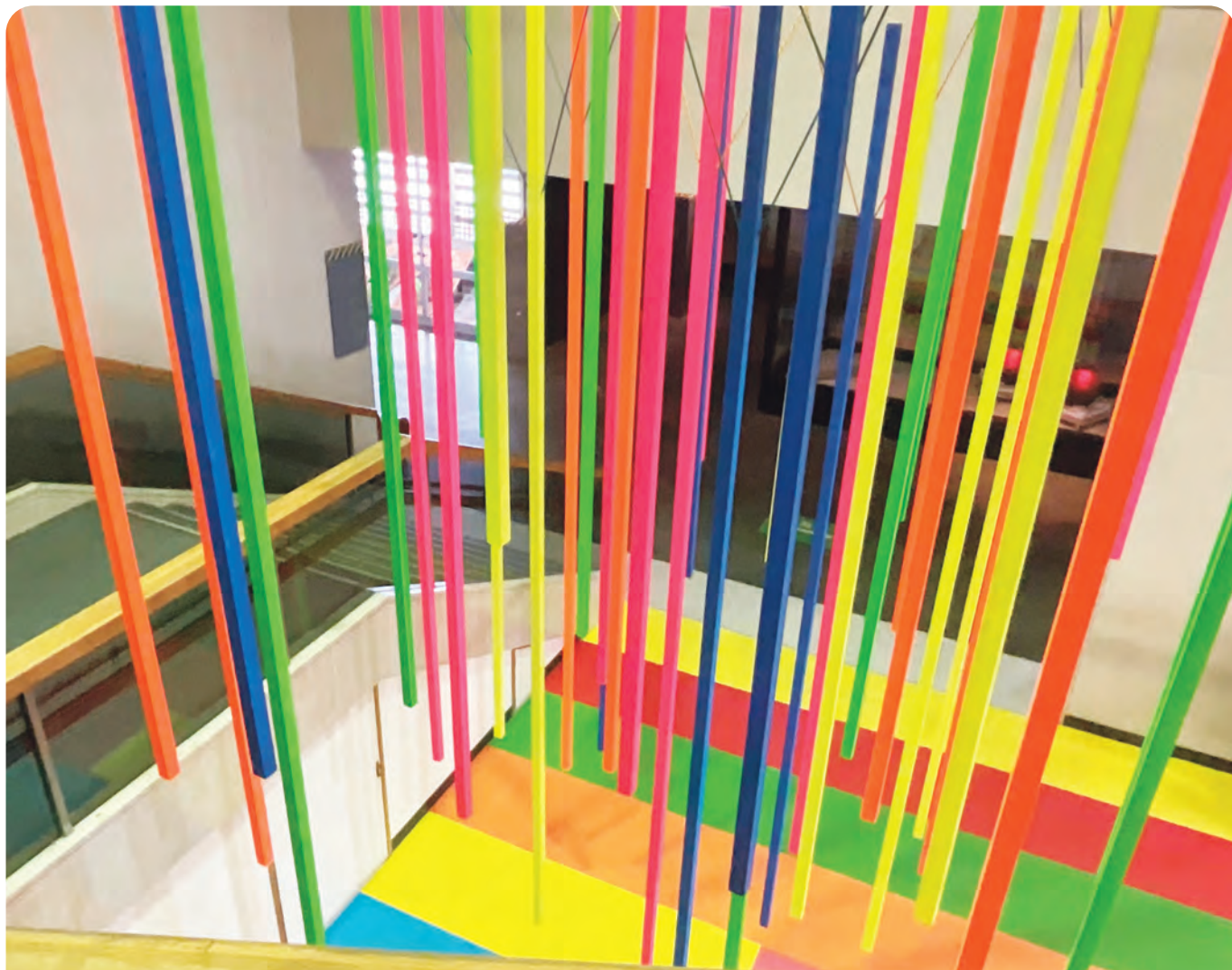
マツモト建築芸術祭 2024 ANNEX 《消えゆく名建築 アートが住み着き 記憶する》 2月23日(金)から3月24日(日)まで 旧松本市立博物館をメイン会場に開催され、有終の美を飾りました。