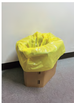
災害時に効果的な携帯トイレ

A 危機管理部長 被災状況にもよるが、断水時でも使用可能な、薬を入れて固める携帯トイレが非常に有効であると考ええる。本市では、25万7500枚、1人1日5回分の計算で5万1500人分の携帯トイレを防災物資ターミナルや小中学校の備蓄倉庫、地区公民館などに備蓄している。この度の能登半島地震では、各地で断水し、携帯トイレが使用されたと聞いている。各家庭においても、自助として最低3日分、できれば7日分の水や食料とともに、携帯トイレを備蓄するよう呼びかけていきたい。