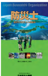
防災士に活躍の場を