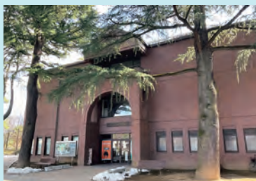
旧制高等学校記念館