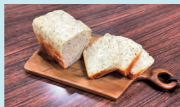
米粉パンの通販を目指して試作中

米粉パンの通信販売をしたいと考えています。実はお好み焼き屋の前に食パンの専門店もやっていたのですが、小麦粉アレルギーで食べられない子どもがとても多いことを知り、そんな子どもたちも食べられる米粉100%のパンを作りたいなど。膨らまないなど課題は多いのですが、松本の水の良さは何より強いのです。いずれは地元の農産物や薪を使った米粉パンを作っていきたいですね。