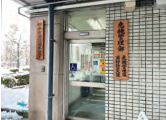
女性の正規職員の配置を

A 危機管理部長 現在、女性の会計年度任用職員が、備蓄用生理用品の種類、数量等の検討に加わっている。避難所環境における女性視点を取り入れること、避難所運営におけるジェンダー平等の視点は今や当然のことであり、それらの視点を持ち、防災対策を進めなければならないと認識している。性別に関わらず、緊急対応に係る業務負担のバランスも考慮しながら、女性職員の配置について検討を進めたい。