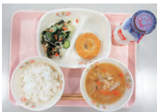
給食では日頃から「旬」を大切に考えながら献立を作成しています

A 現状としては、321 品目の給食食材を令和 3 年と令和 5 年で比較したところ、238 品目で価格上昇、56 品目で据え置き、27 品目で下落している。日本銀行の経済・物価情勢の展望によると、令和 6 年度の物価は 1.9 % 上昇の見通しである。今回の補正予算にこれを反映するため、令和 6 年度の当初予算においても、日本銀行の物価見通しに合わせて 1.9 % の物価上昇を見込んだ予算計上としている。