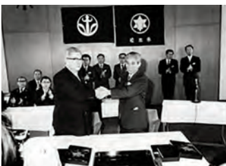
昭和 49 年の本郷村合併時の様子

住民自治局長 松本平の中でも最古級の歴史と文化を誇り、豊かな自然や観光資源を擁する本郷村と松本市の合併は、本市の市政発展に大きく寄与した。今回、合併五十周年を迎えることは、本市にとっても意義深く、何らかのイベント開催を前向きに検討する。イベントの内容について、本郷地区の住民の皆さんと相談しながら決定する。