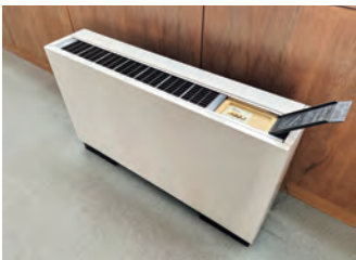
庁舎の冷暖房の稼働延長

財政部長 猛暑日の増加といった昨今の気候条件の変化から、現状の余熱を利用した温度管理では不十分な状況が生じる場合があると認識しており、冷暖房の運用の見直しは、必要だと考える。省エネや勤務体制、経費の増加といった観点を踏まえ、機器の停止作業の時間を考慮し、午後4時50分程度までは稼働延長したい。