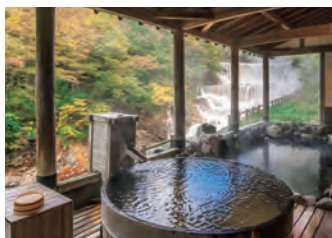
安心して利用できる環境づくりを

A 文化観光部長 所管する入浴施設では、入れ墨のある方への対応に限らず、入浴マナー、利用者間のトラブルなど様々な問題がある。指定管理者に対し、入浴マナーなど利用時のお願い事項の周知徹底を図るとともに、スタッフがこまめに施設内を巡回するなど、安心して利用できる環境づくりに取り組んでいく。