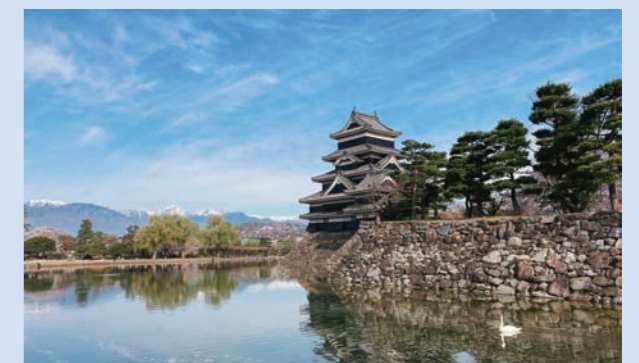
北アルプスを借景に内堀にそびえる天守

史跡松本城の大部分は、都市公園「松本城公園」として市民に親しまれています。周辺建物の高さ規制等により、本丸や二の丸から天守とその背景に北アルプス、美ヶ原を望むことができ、往時にも眺められたと考えられる歴史的景観が保たれています。北アルプスを借景に内堀にそびえる天守の風景は、松本を象徴する景観として広く受け入れられ、地域の誇りとなっています。松本城は現代に至るまで、地域とともに歴史を歩んできた松本を代表する地域遺産と言えます。