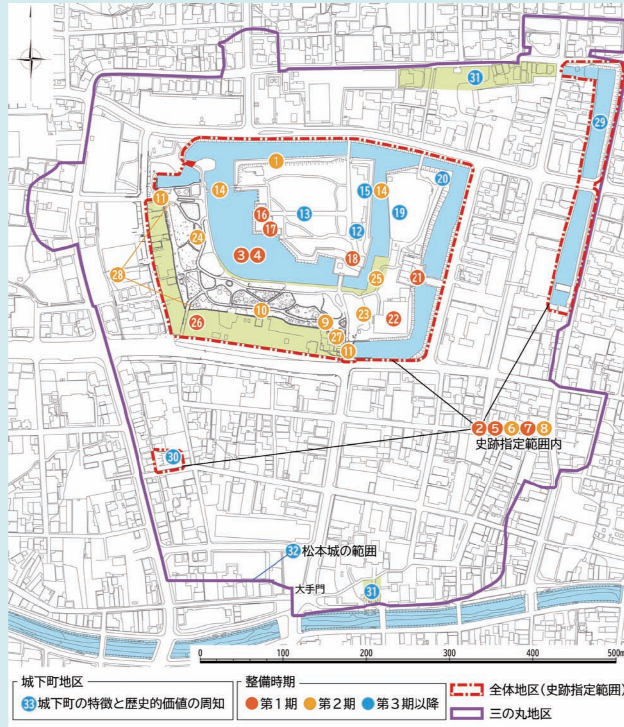
史跡松本城及びその周辺整備における整備項目

松本城が松本市のシンボルとして、また松本城を中心としたまちづくりの核としてあり続け、市民や次世代を担う子どもたちが松本城や地域の歴史に誇りを持てるよう、各種まちづくり計画、景観計画等との整合を図るとともに、市民との協働による保存・活用整備を図ります。