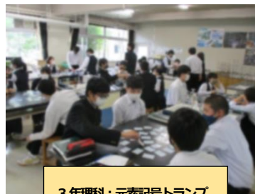
3年理科：元素記号トランプ