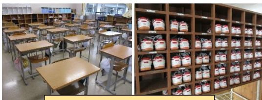
きれいに整え（揃え）られた教室・下駄箱