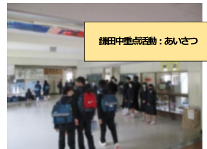
鎌田中重点活動：あいさつ