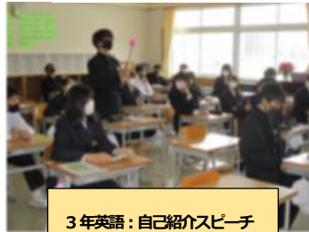
3年英語：自己紹介スピーチ