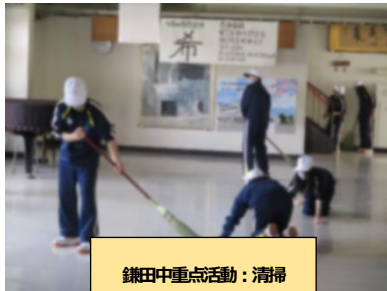
鎌田中重点活動：清掃