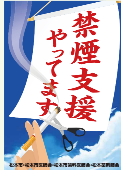
松本市・松本市医師会・松本市歯科医師会・松本薬剤師会 このポスターの掲示してある薬局が、禁煙支援薬局です。