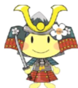
甲冑アルプちゃん