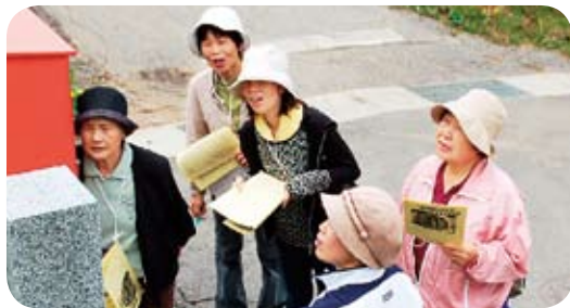
▲ウォークラリー大会