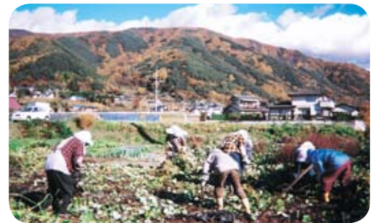
▲さつまいもの栽培（遊休農地を利用して）

なお、4月に入山辺、里山辺公民館主催のウォークラリー大会の参加の呼びかけが農村女性委員会にあり、参加する事になりました。ウォークラリーは初めて参加するので、どんな問題が出るかと