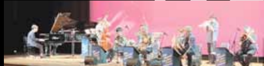
OLD&NEW DREAM JAZZORCHESTRA

聴き馴染みのある楽曲やオリジナル音楽、ワールドミュージックを演奏する、アルトサックス、トロンボーン、バリトンサックスによる音楽器ユニット