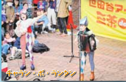
チャラン・ポ・ランタン

「歌とアコーディオンの姉妹ユニット」。シャンソン・バルカン音楽などを主に東西あらゆる音楽ジャンルを取り入れた無国籍のサウンドやサーカス風の独特な世界観が特色