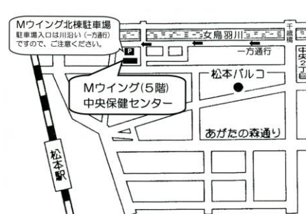
中央保健センター