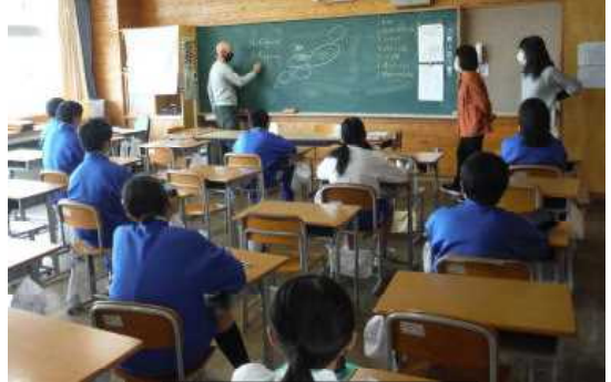
教科担任との顔合わせ

14日、生徒の笑顔と明るい声が教室に戻ってきました。4月9日から始まった再度の臨時休業で、週一回の課題受け渡しが続いていましたが、ようやく教室での活動が始まり、先週末からは授業がスタートしました。分散登校が始まってからは、授業再開に向けた学校生活リズムづくりと、避難経路等の確認で新しい教室からの非常時（今も別の意味で非常時ですが…）の動きを確認したり、本年度の教科担任と顔合わせをして、授業再開への意欲を高めたりしてきました。そして、22日には最初の授業が行われました。まだ半数ずつではありますが、生徒の声や笑顔も増えてきて、これから活気が戻ってくる期待が感じられました。