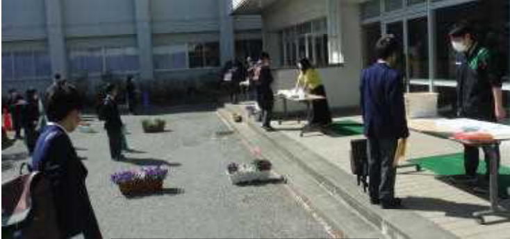
昇降口前での連絡・課題受け渡し