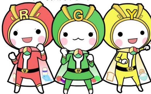
すくすくレッド おたすけグリーン ほかほかイエロー

わたしたちのように赤・緑・黄の食材がそろった栄養バランスのよいごはんは食べているかな？確認してみよう！