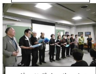
スポーツボイスサークル