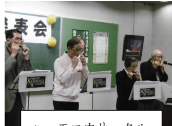
ハーモニカサークル