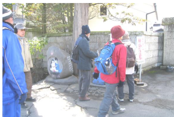
島立地区へ (裏面もごらんください)