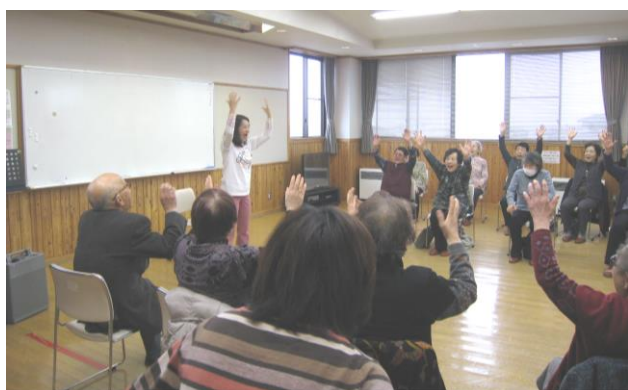
笑いヨガの様子 皆でワッハッハ~!