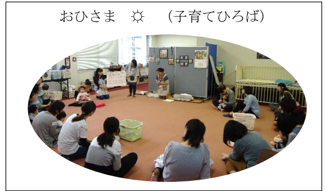
おひさま ☀ (子育てひろば)